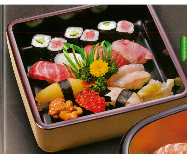
宮古にぎり (お寺様用) 3,740円