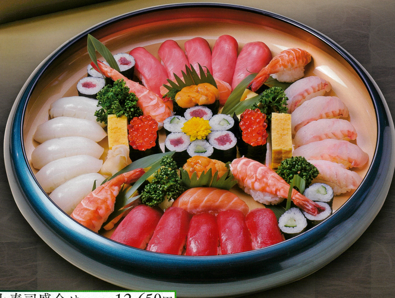
上寿司盛合せ(5人盛) 12,650円