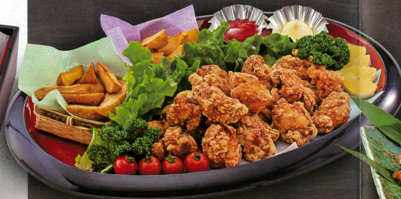
とりの唐揚げと ポテトフライ盛合せ 4,400円