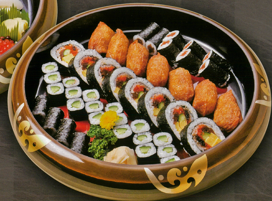
いなり巻寿司盛合せ(5人盛) 4,950円

※表示価格はすべて消費税込みの価格です。※季節によってお料理の内容が異なる場合がございます。