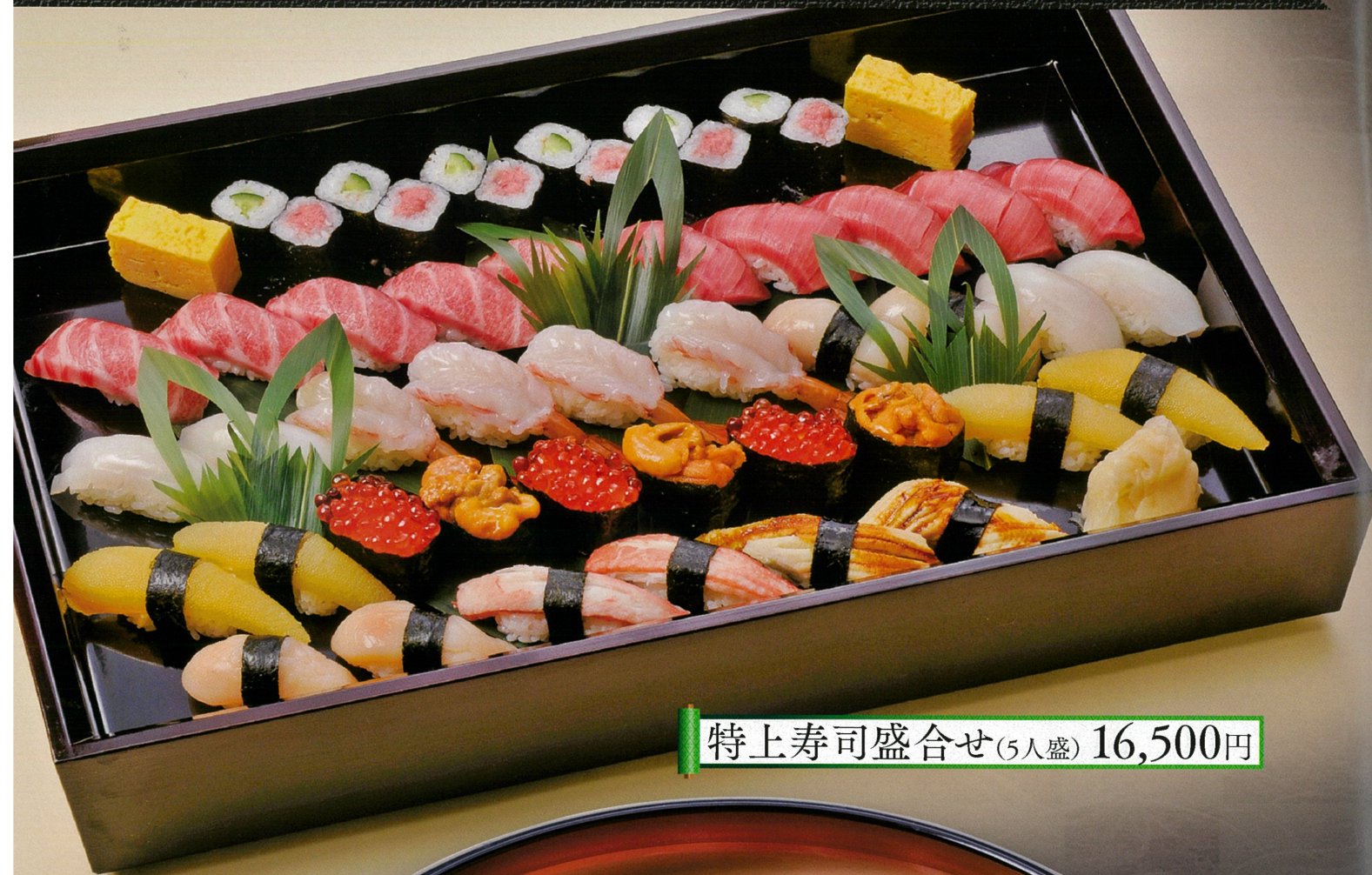
特上寿司盛合せ(5人盛) 16,500円

新鮮な海の恵を心をこめて…職人が織りなす こだわりのにぎりを是非ご堪能ください。