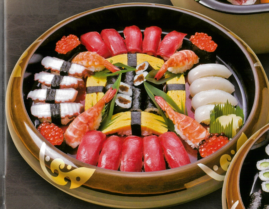
並寿司盛合せ(5人盛) 9,350円