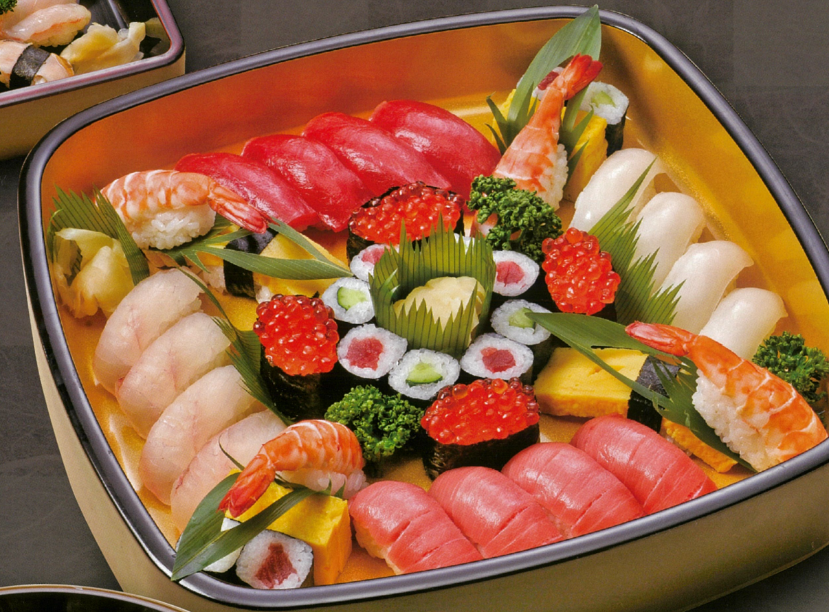
上寿司盛合せ(4人盛) 10,120円